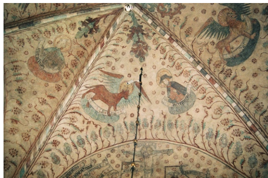
Kryssvalv med kalkmålningar.

På norra sidan, angränsande till långhuset , finns predikstolen från 1700-talets mitt av marmorerat trä med snidad, förgylld dekor och