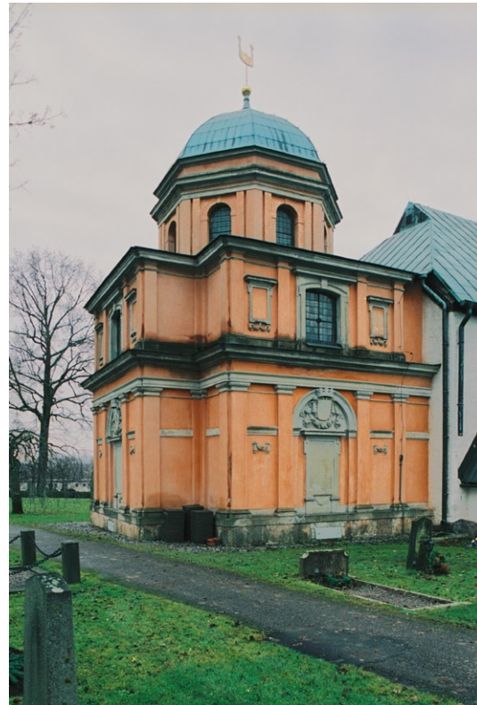
Bondeska gravkorets exteriör från nordost.

Vapenhuset nås via en bräddörr med smidesbeslag och stocklås . I kalkstensgolvet ligger två gravhällar av kalksten. Väggarna är putsade och målade och har fragment av figurativa kalkmålningar. Kryssvalvets kalkmålningar är troligen från 1400-talet men påmålade 1905. Kyrkans äldsta gravstenar, tre stycken med runskrift från 1100-talet, står i vapenhuset . Nischer finns i