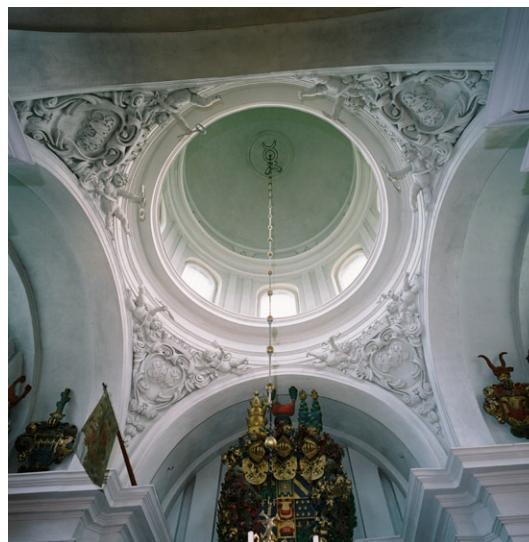
Kupolen i Bondeska gravkoret.

ljudtak över. Intill predikstolen står en flygel och i söder en dopfont av sandsten från 1943. I taket hänger fyra malmkronor och på väggarna sitter lampetter i mässing och koppar på skenor av smidesjärn. I norr leder en rundbågig dörröppning till sakristian och en spetsbågig till det tillbygga skrudhuset.