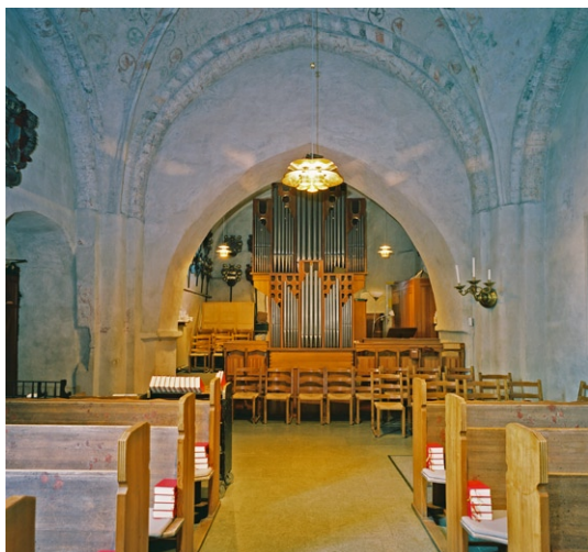
Kyrkorummet mot orgeln i väster