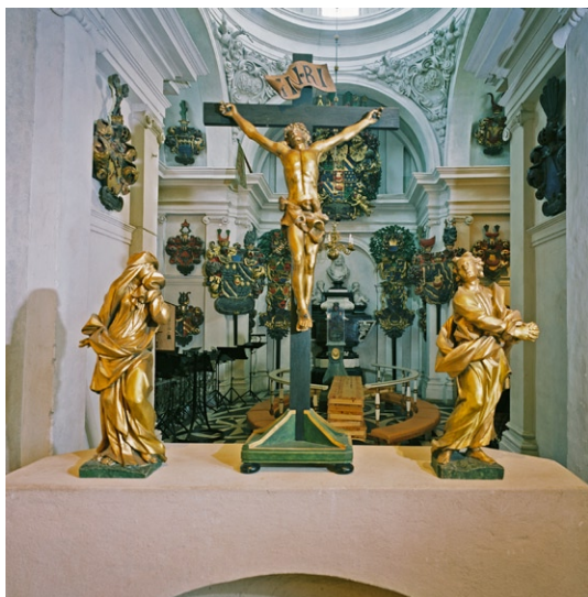
Förgyllda skulpturer, troligen av Burchardt Precht. I fonden Bondeska gravkoret.