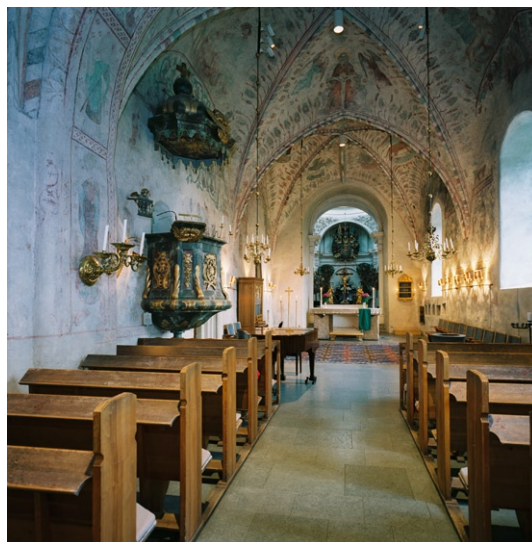
Kyrkorummet mot koret med predikstolen till vänster.

muren står ett krucifix flankerat av förgyllda träskulpturer, troligen gjorda av Burchardt Precht på 1690-talet medan krucifixet är en gipskopia. Altarringen med smala balusterdockor är samtida med altaret liksom korstolarna utmed söderväggen.